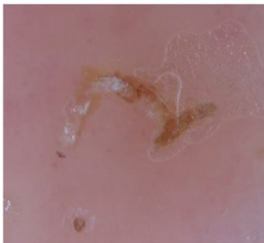
Abbildung 1. Positives Delta-Sign in der Dermatoskopie

Die Erkrankung beginnt häufig mit heftigem Juckreiz, vor allem nachts bei Bettwärme. An der Haut zeigen sich kleine Pusteln, einzeln oder in Gruppen. Die oben beschriebenen Gänge können bei heller Haut manchmal als unregelmässige Linien mit blossem Auge gesehen werden. Häufig sind Kratzspuren sichtbar. Bevorzugte Körperstellen sind Zwischenfingerräume, Handgelenke, Achseln, Ellenbogen, Leisten, Genitalregion und Knöchelbereich. Bei Säuglingen und Kleinkindern können auch Kopf und Gesicht betroffen sein.